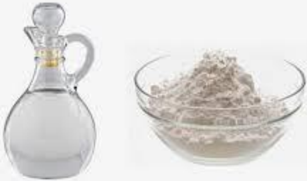
Vinagre Branco e Bicarbonato de Sódio

Muito usado para tira mofo de móveis fechados como guarda roupas e guarda alimentos.